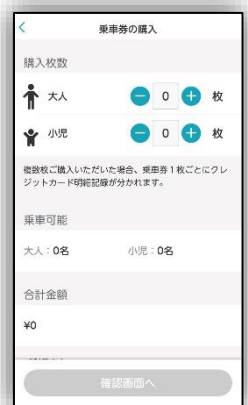
参考：画面イメージ