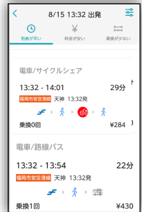
参考：画面イメージ