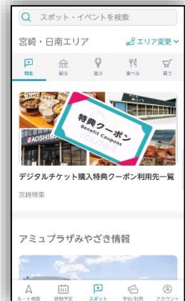
参考：画面イメージ